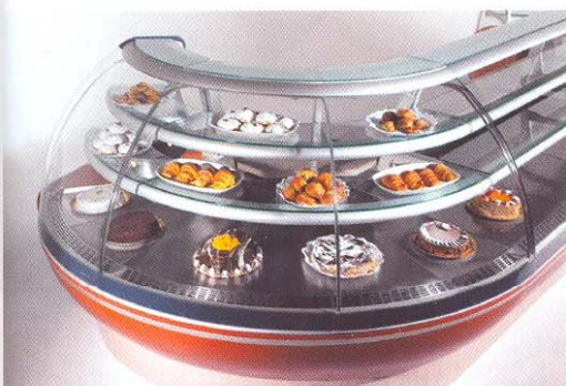
A sinistra, vetrina del sistema Passion; in alto, Elegance: due linee firmate Jordao Cooling Systems.