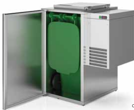
capacidade capacity 480L