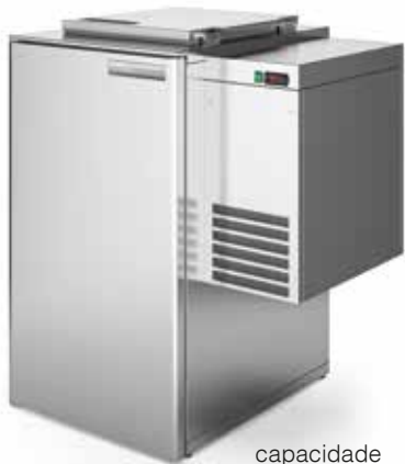
capacidade capacity 240L