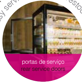
portas de serviço rear service doors

fácil serviço e reposições rápidas easy service and quick restocking