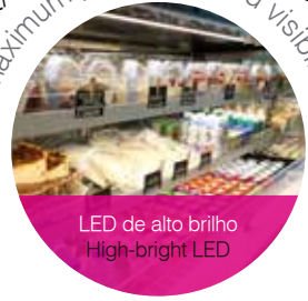
LED de alto brilho High-bright LED

máxima promoção e visibilidade maximum promotion and visibility