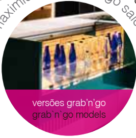
versões grab'n'go grab n' go models

maximiza as vendas grab'n'go maximises grab and go sales