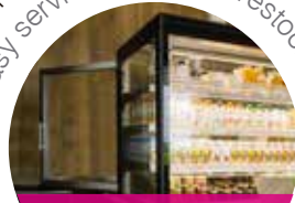
portas de serviço rear service doors

fácil serviço e reposições rápidas easy service and quick restocking