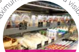
LED de alto brilho High-bright LED

máxima promoção e visibilidade maximum promotion and visibility