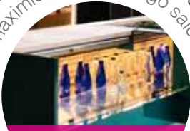
versões grab'n'go grab'n'go models

maximiza as vendas grab'n'go maximises grab and go sales