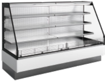
SM HF2 CC com costas em inox with stainless steel back