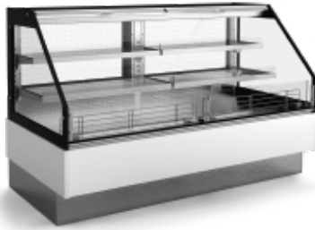
SM HF2 CC com costas panorâmicas with see-through back