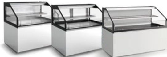
Grab & Go