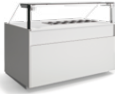
Balcão Piza Piza counter