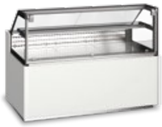
Vitrina Display case